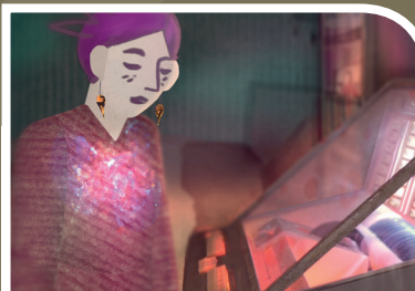
MON JUKE-BOX de Florentine Grelier