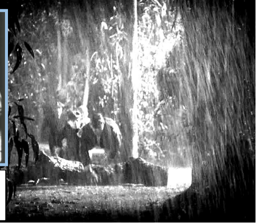
Dans Freaks (Tod Browning – 1932) , Cléopâtre, manipulatrice sera poursuivie par la troupe du cirque jusqu'à être enfermée dans une boîte...