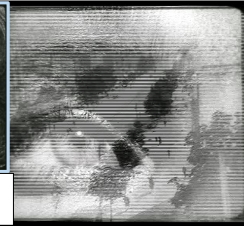
Dziga Vertov réalise en 1929, l'Homme à la caméra dans lequel il expérimente des axes et superpositions d'images pour traduire le quotidien.